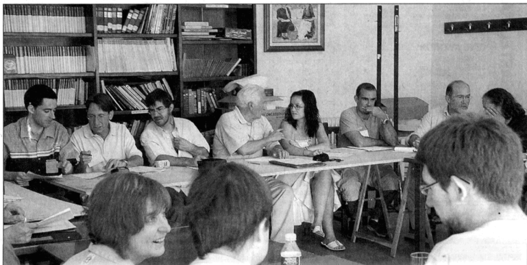
Este encuentro reunió a unos 25 creadores de páginas web de la provincia

Internet lleva permitiendo alojar páginas personales desde hace unos diez años, por ello hay quien ha elegido como tema su pueblo, razón por la que en la actualidad existen determinadas páginas en la Red sobre estos municipios. Pero